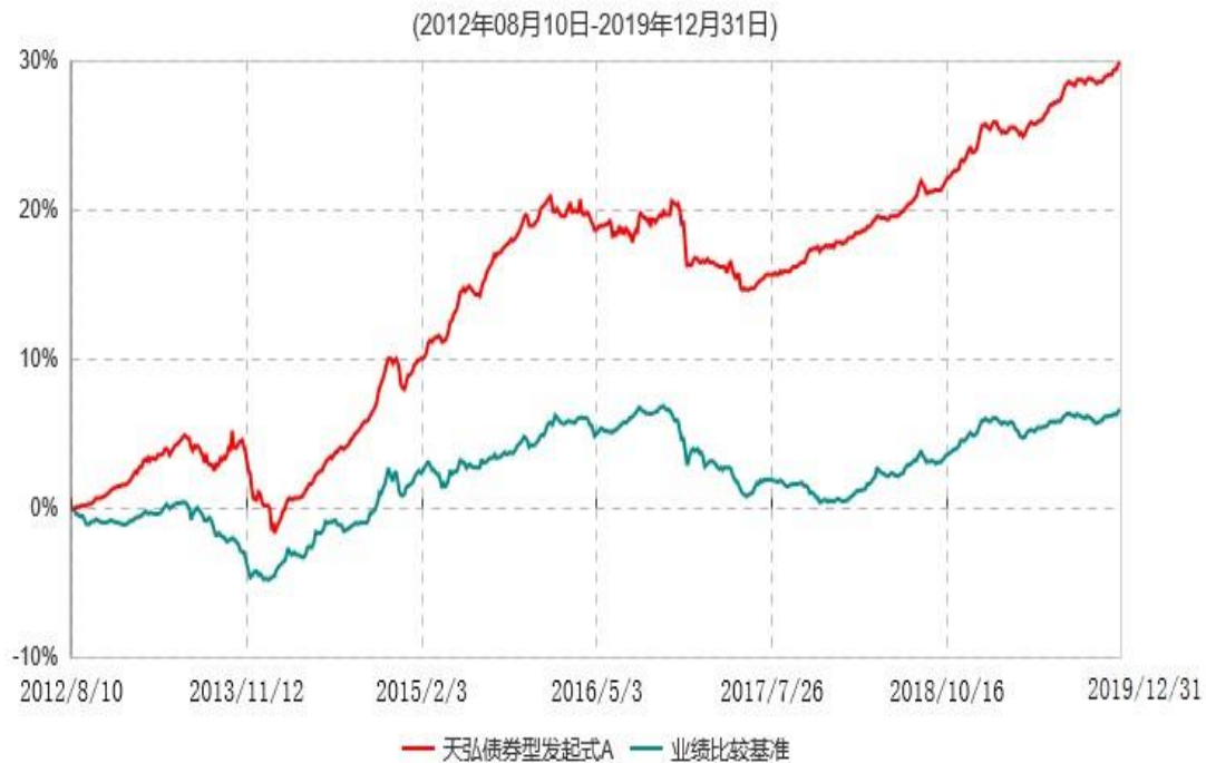
天弘债券型发起式A累计净值增长率与业绩比较基准收益率历史走势对比图