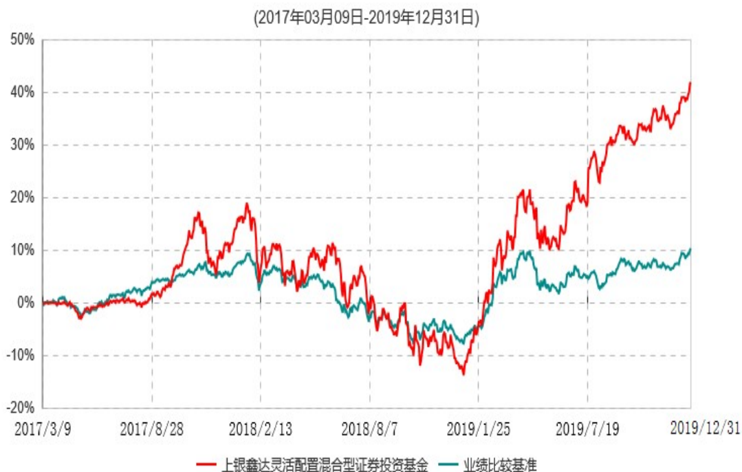
上银鑫达灵活配置混合型证券投资基金累计净值增长率与业绩比较基准收益率历史走势对比图