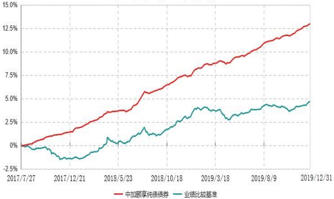
中加颐享纯债债券型证券投资基金累计净值增长率与业绩比较基准收益率历史走势对比图 (2017年07月27日-2019年12月31日)