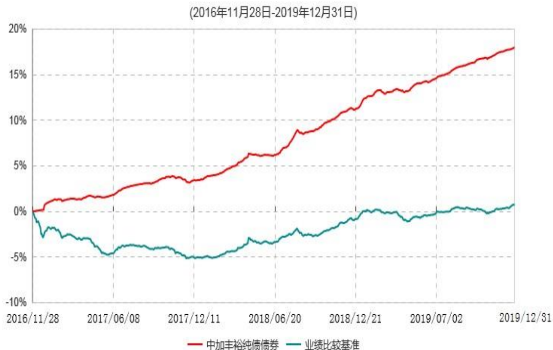
中加丰裕纯债债券型证券投资基金累计净值增长率与业绩比较基准收益率历史走势对比图