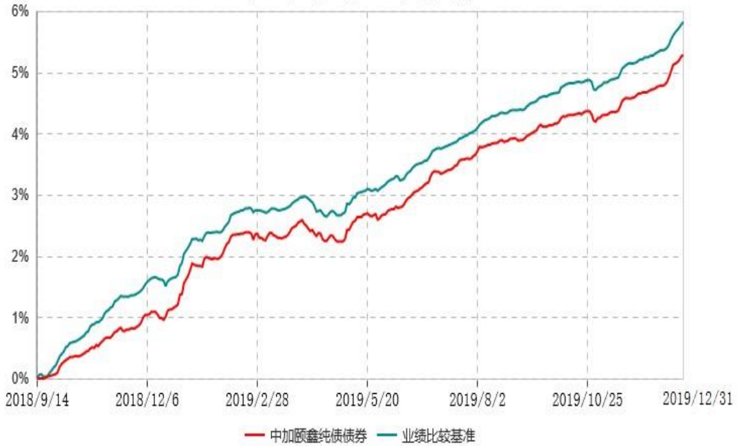
中加颐鑫纯债债券型证券投资基金累计净值增长率与业绩比较基准收益率历史走势对比图 (2018年09月14日-2019年12月31日)

注：1.本基金基金合同于2018年9月14日生效，截至报告期末，本基金基金合同生效已满一年。