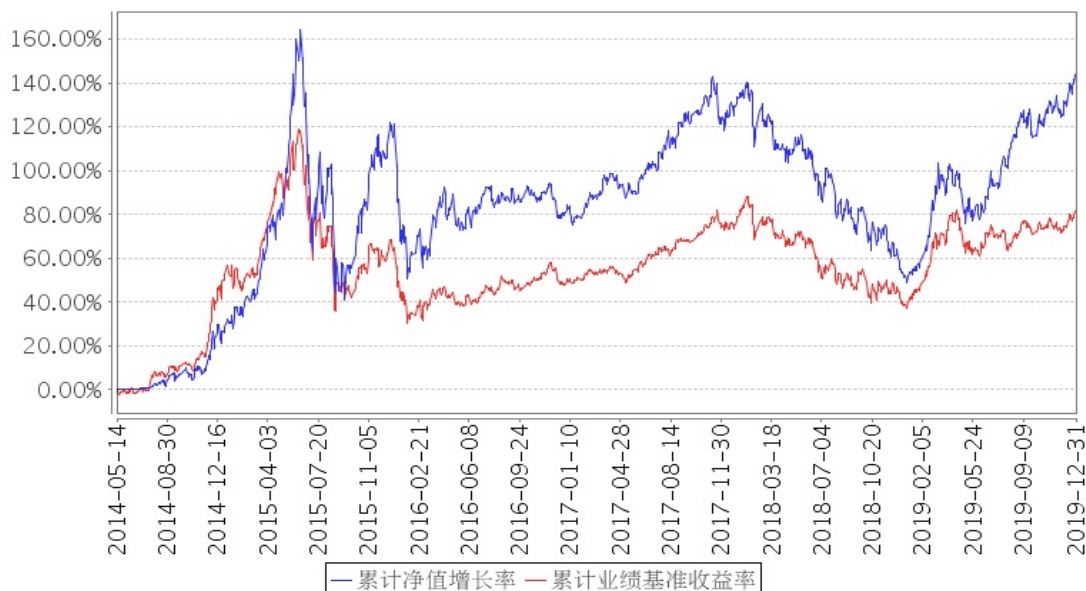
建信改革红利股票累计净值增长率与同期业绩比较基准收益率的历史走势对比图