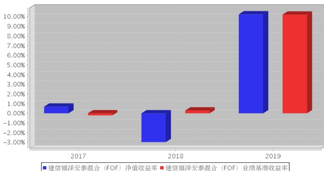
建信福泽安泰混合 (FOF) 基金每年净值增长率与同期业绩比较基准收益率的对比图