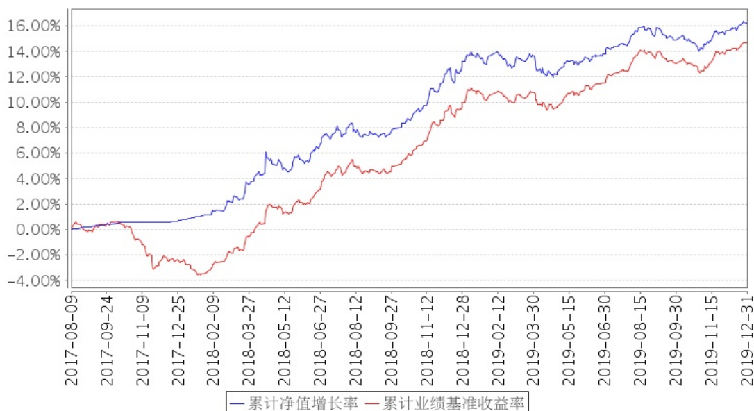
政金债8-10LOF累计净值增长率与同期业绩比较基准收益率的历史走势对比图