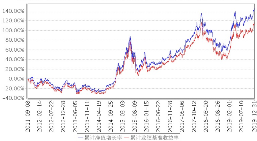
深F60ETF累计净值增长率与同期业绩比较基准收益率的历史走势对比图