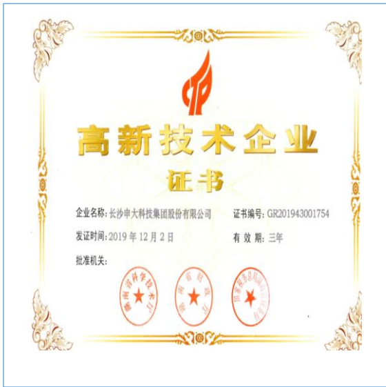
2019 年公司继续获得高新技术企业证书