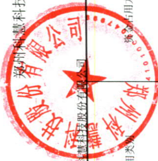
附件 郑州科慧科技股份有限公司2019年度控股股东、实际控制人及其关联方资金占用情况汇总表