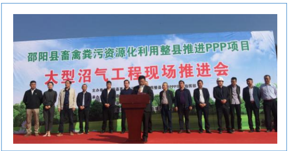
2019年11月1日,邵阳县畜禽粪污资源化利用整县推进项目正式开工建设