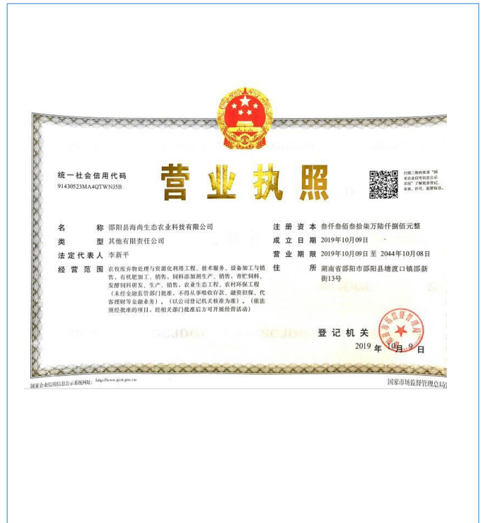
2019年10月9日,控股子公司邵阳县海尚生态农业科技有限公司成立