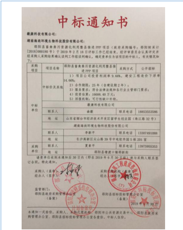
2019年5月30日,成功中标邵阳县畜禽粪污资源化利用整县推进项目