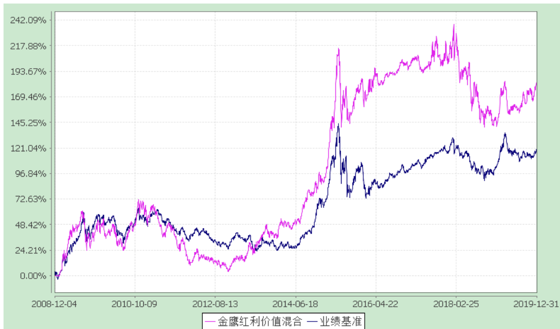
金鹰红利价值灵活配置混合型证券投资基金 累计净值增长率与业绩比较基准收益率历史走势对比图 (2008年12月4日至2019年12月31日)