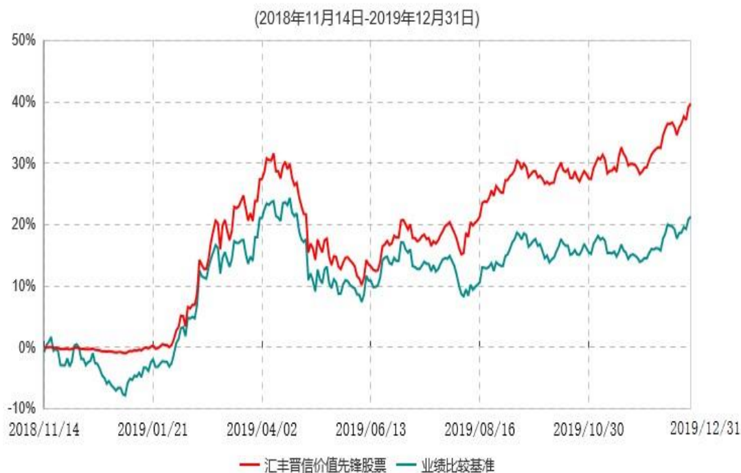
汇丰晋信价值先锋股票型证券投资基金累计净值增长率与业绩比较基准收益率历史走势对比图