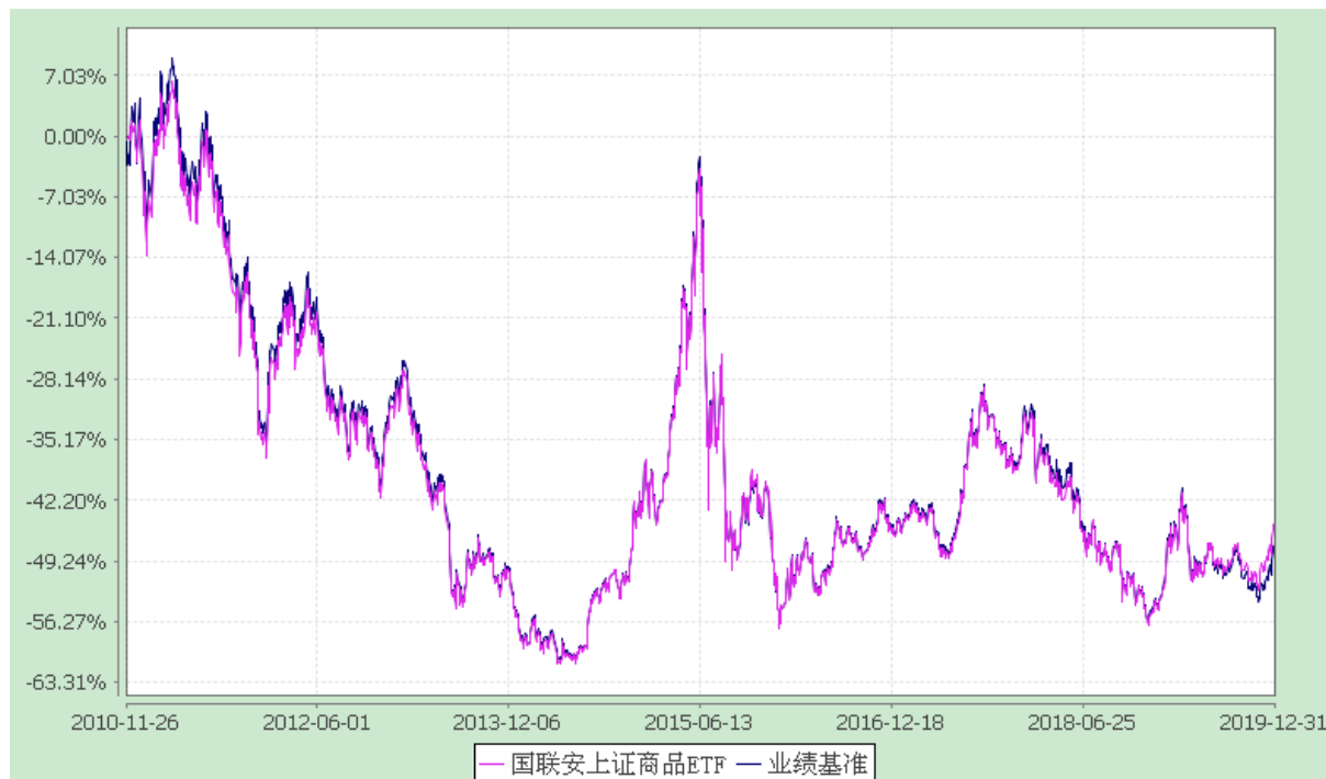
自基金合同生效以来份额累计净值增长率与业绩比较基准收益率的历史走势对比图 (2010 年 11 月 26 日至 2019 年 12 月 31 日)