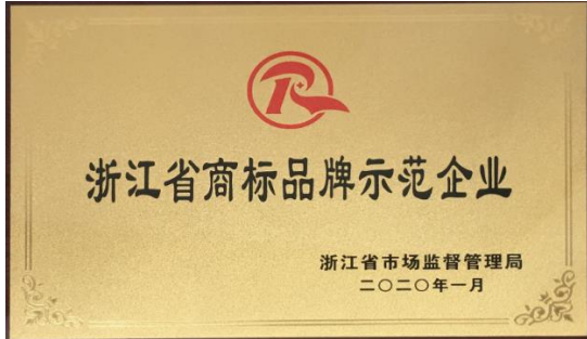
公司被评为浙江省商标品牌示范企业