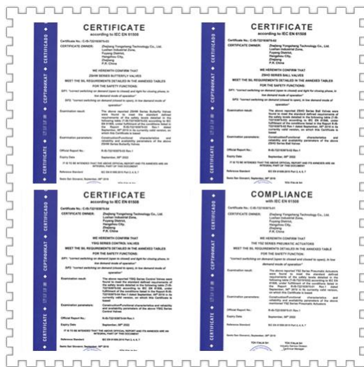
公司获得南德 TÜV-SIL 认证证书

报告期内，本公司完成了非公开发行股票发行，公司总股本从 54,108,000 股增至 60,120,000 股。