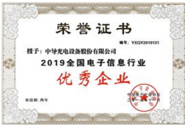
公司荣获《2019年全国电子信息行业 优秀企业》称号