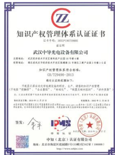
2019.11.27 子公司武汉中导获得 《知识产权管理体系认证证书》