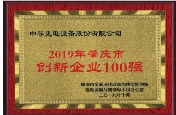
公司被评为《2019年肇庆市 创新企业100强》