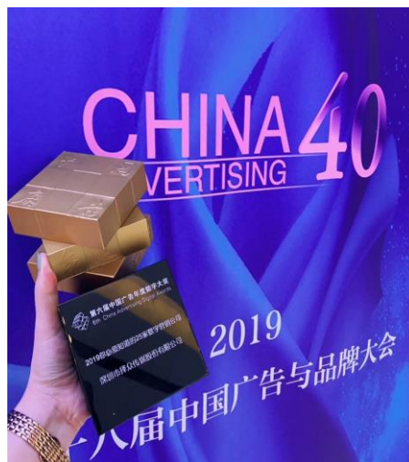
公司荣获第六届中国广告年度数字大奖 2019 年你必须知道的 25 家数字营销公司。