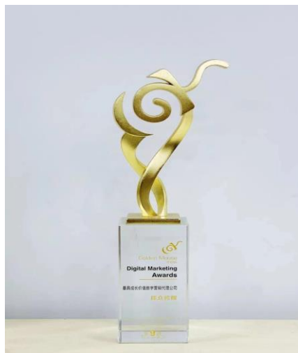
公司荣获第九届金鼠标最具成长价值数字营销代理公司。