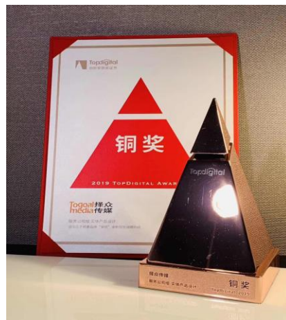
公司荣获 2019 年 Topdigital 创新盛典服务公司组实体产品设计铜奖。