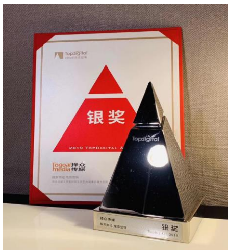
公司荣获 2019 年 Topdigital 创新盛典服务商组电商营销银奖。