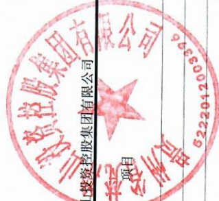
母公司所有者权益变动表 2019年度