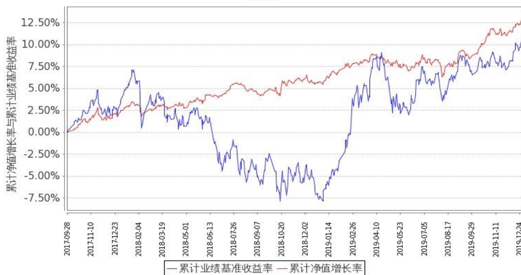
图1：嘉实新添辉定期混合A基金份额累计净值增长率与同期业绩比较基准收益率的历史走势对比图