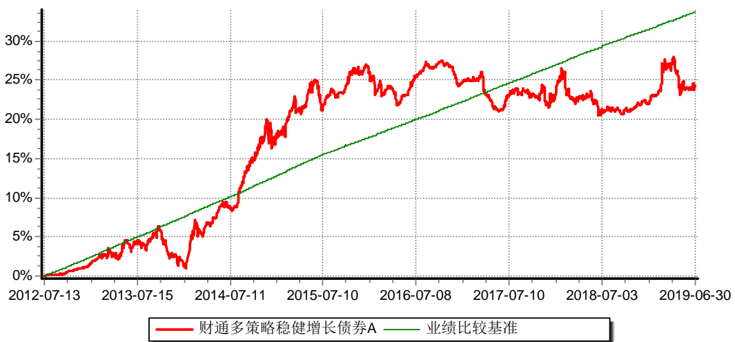
财通多策略稳健增长债券型证券投资基金A 累计净值增长率与业绩比较基准收益率历史走势对比图 (2012年7月13日-2019年6月30日)