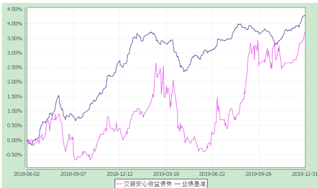
交银施罗德安心收益债券型证券投资基金 份额累计净值增长率与业绩比较基准收益率历史走势对比图 (2018 年 6 月 2 日至 2019 年 12 月 31 日)

注：本基金由交银施罗德荣和保本混合型证券投资基金转型而来。本基金转型日为 2018 年 6 月 2 日。本基金的投资转型期为交银施罗德荣和保本混合型证券投资基金保本周期到期期间截止日的次日（即 2018 年 6 月 2 日）起的 3 个月。截至投资转型期结束，本基金各项资产配置比例符合基金合同及招募说明书有关投资比例的约定。