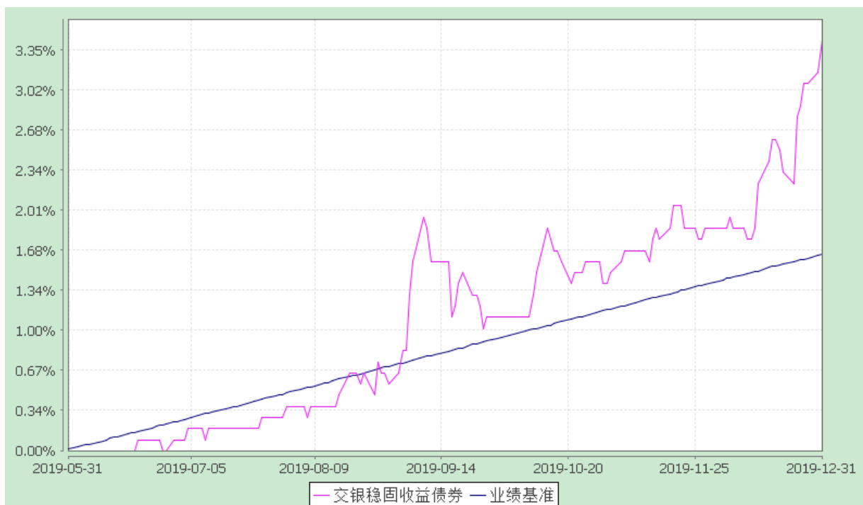
交银施罗德稳固收益债券型证券投资基金 份额累计净值增长率与业绩比较基准收益率的历史走势对比图 (2019 年 5 月 31 日至 2019 年 12 月 31 日)