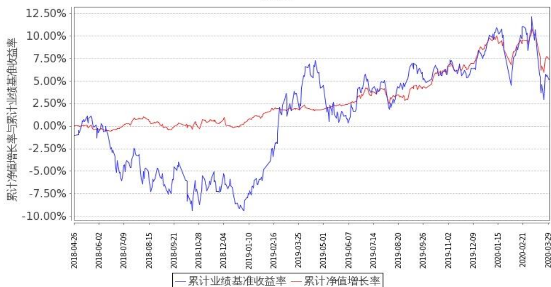
图1：嘉实新添荣定期混合A基金份额累计净值增长率与同期业绩比较基准收益率的历史走势对比图