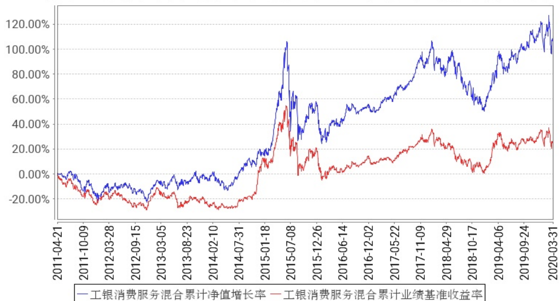
工银消费服务混合累计净值增长率与同期业绩比较基准收益率的历史走势对比图