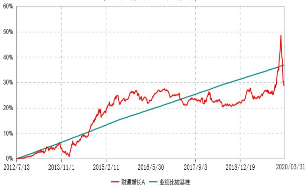
财通增长C累计净值增长率与业绩比较基准收益率历史走势对比图