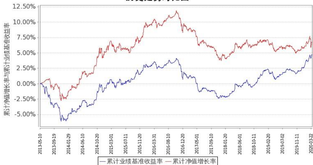
图1：嘉实中证金边中期国债ETF联接A基金份额累计净值增长率与同期业绩比较基准收益率的历史走势对比图 (2013年5月10日至2020年3月31日)