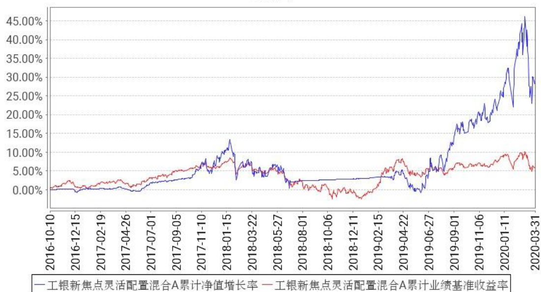
工银新焦点灵活配置混合A累计净值增长率与同期业绩比较基准收益率的历史走势对比图