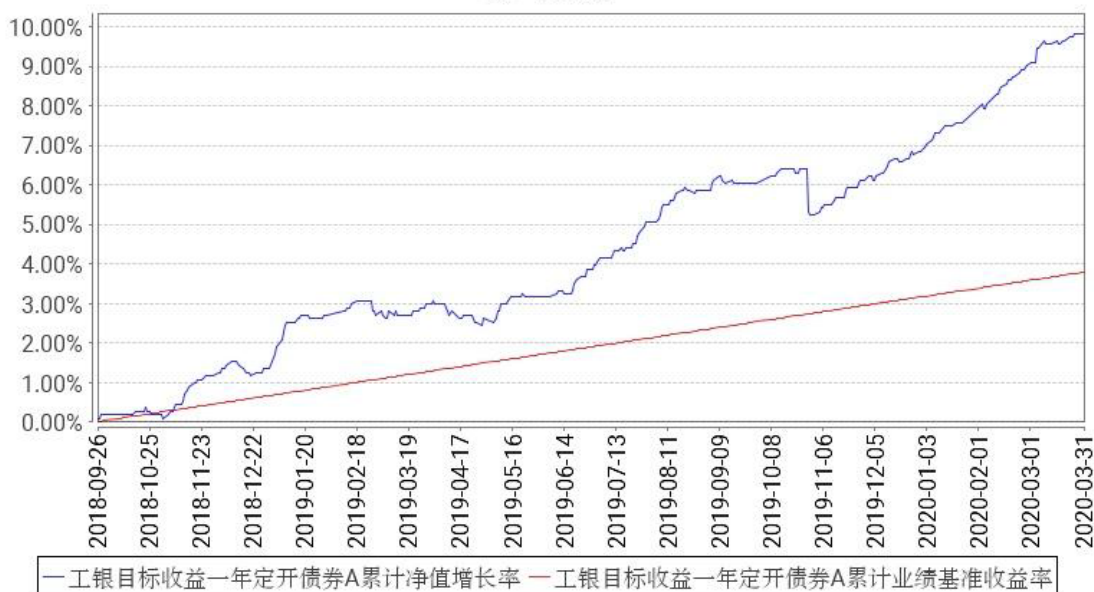
工银目标收益一年定开债券A累计净值增长率与同期业绩比较基准收益率的历史走势对比图