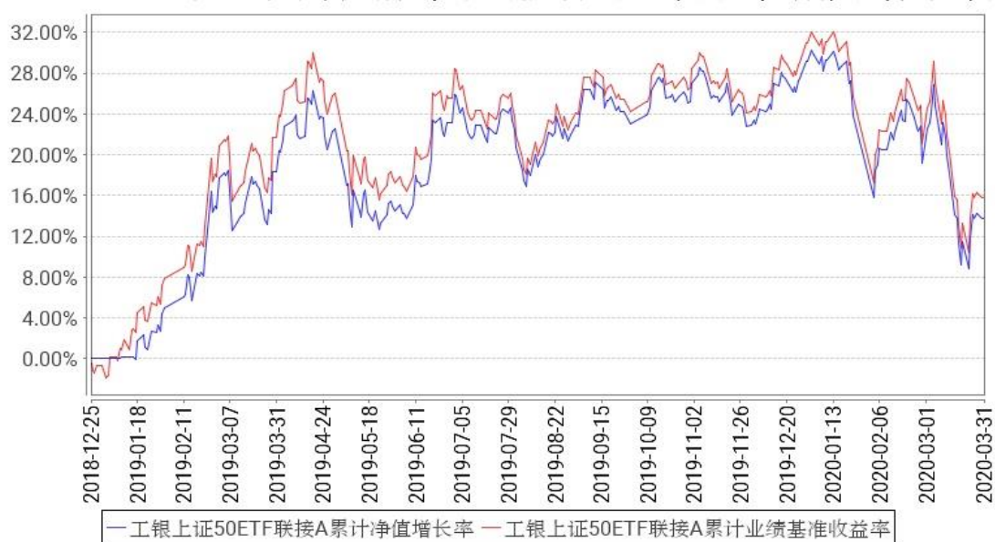
工银上证50ETF联接A累计净值增长率与同期业绩比较基准收益率的历史走势对比图