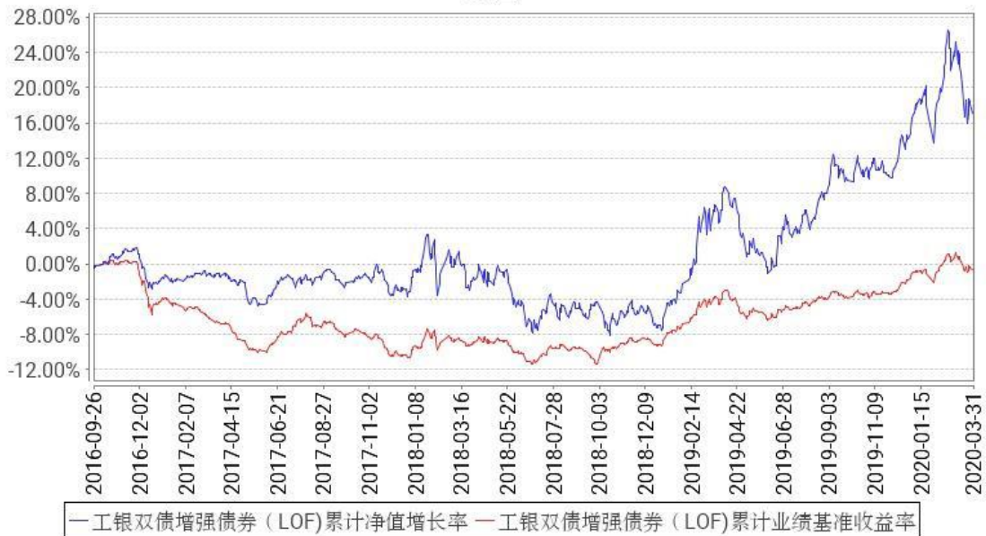
工银双债增强债券（LOF）累计净值增长率与同期业绩比较基准收益率的历史走势对比图