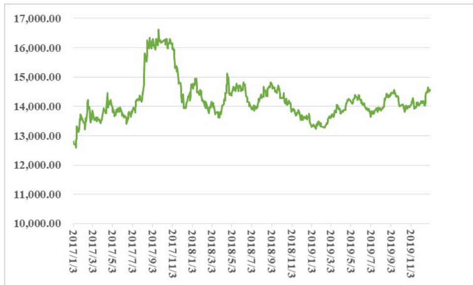
南海有色（灵通）金属铝锭现货价格趋势图 （2017 年 1 月-2019 年 12 月，单位：元/吨）

如上图所示，报告期内铝锭价格存在一定的波动性。公司采用以销定产的生产模式，较大程度上可以应对铝型材价格变动带来的影响。