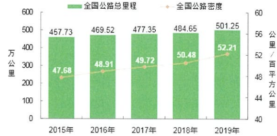
图 2：2015 年~2019 年全国公路总里程及公路密度

截至 2019 年末，全国公路总里程 501.25 万公里，比上年增加 16.60 万公里。公路密度 52.21 公里/百平方公里，增加 1.73 公里/百平方公里。公路养护里程 495.31 万公里，占公路总里程 98.8%。全国四级及以上等级公路里程 469.87 万公里，比上年增加 23.29 万公里，占公路总里程 93.7%，提高 1.6 个百分点。二级及以上等级公路里程 67.20 万公里，增加 2.42 万公里，占公路总里程 13.4%，占比与上年基本持平。高速公路里程 14.96 万公里，增加 0.70 万公里；高速公路车道里程 66.94 万公里，增加 3.61 万公里。国家高速公路里程 10.86 万公里，增加 0.31 万公里。