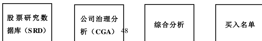
图 1 股票选择流程

本基金的股票投资遵循“自下而上”的个股选择策略，并遵守透明而有纪律的选股流程，如图 1 所示。