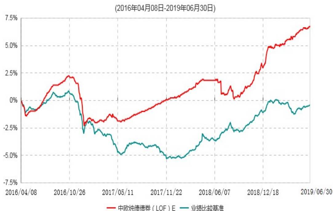
中欧纯债债券（LOF）E累计净值增长率与业绩比较基准收益率历史走势对比图

注：自 2016 年 4 月 6 日起，本基金新增 E 类份额，图示日期为 2016 年 4 月 8 日至 2019 年 06 月 30 日。