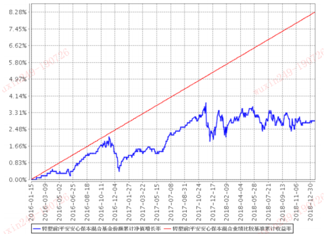
平安安心保本混合基金份额累计净值增长率与同期业绩比较基准收益率的历史走势对比图

注：1、本基金基金合同于 2016 年 1 月 15 日正式生效，截至报告期末已满三年；