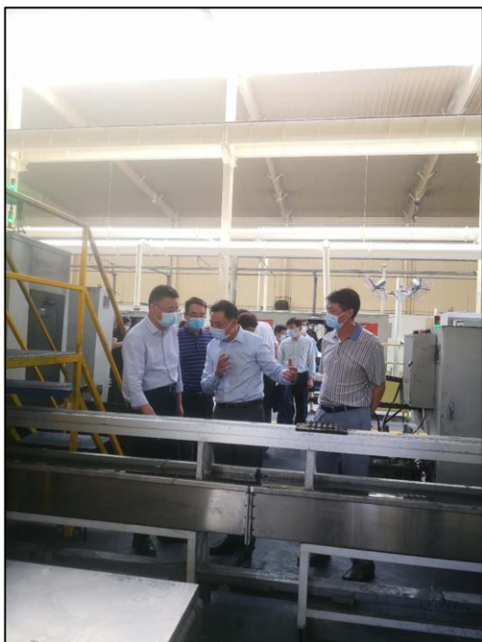
湖北省商务厅厅长秦勇来公司调研