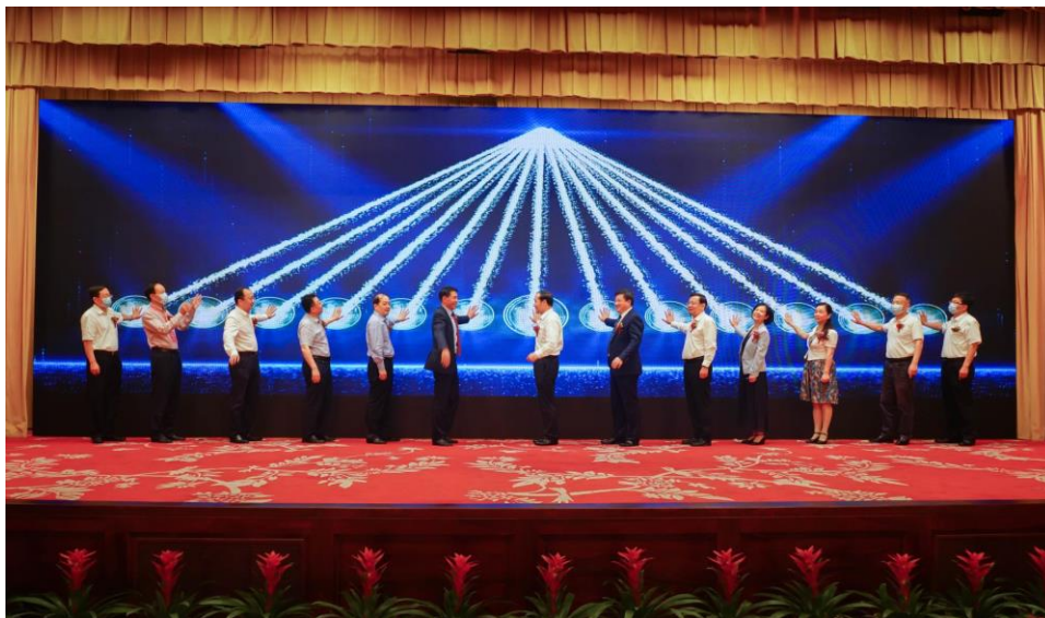
公司成为全国首批、湖北省第一家 向不特定合格投资者公开发行股票并在精选层挂牌企业