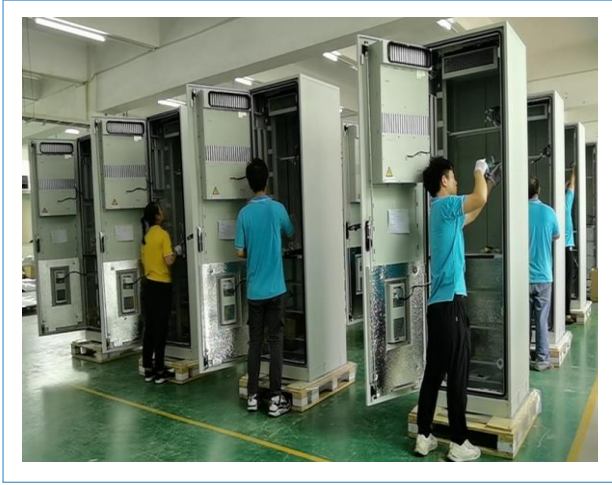
本年新开发的产品——5G 通讯电源机柜