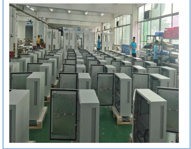
本年新开发的产品——5G 通讯外挂壁柜