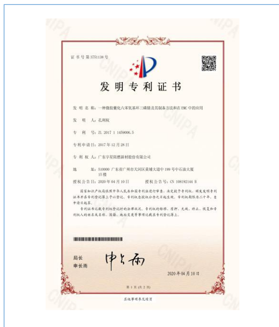
2020 年 4 月 10 日，公司取得《一种微胶囊化六苯氧基环三磷腈及其制备方法和在 EMC 中的应用》发明专利授权。