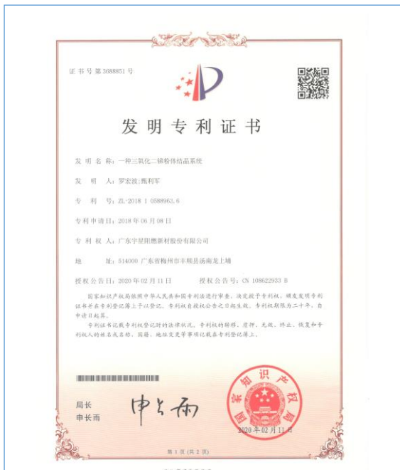
2020 年 2 月 11 日，公司取得《一种三氧化二锑粉体结晶系统》发明专利授权。