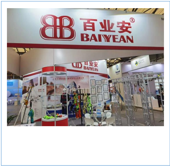
公司参加了第 100 届上海劳保展