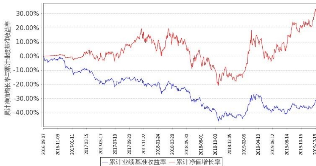
图 1：嘉实文体娱乐股票 A 基金份额累计净值增长率与同期业绩比较基准收益率的历史走势对比图