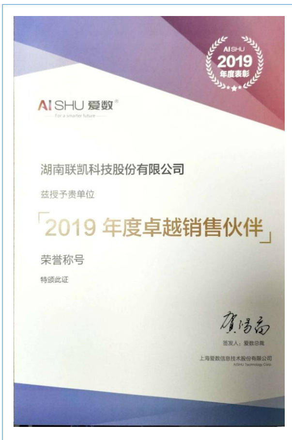
荣获上海爱数 2019 年度卓越销售伙伴