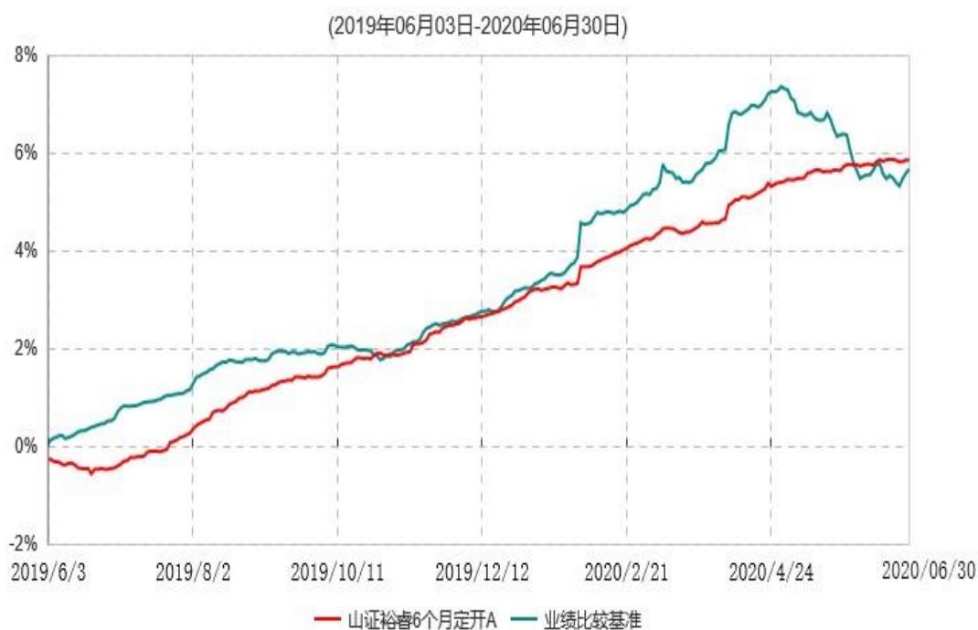
山证裕睿6个月定开A累计净值增长率与业绩比较基准收益率历史走势对比图