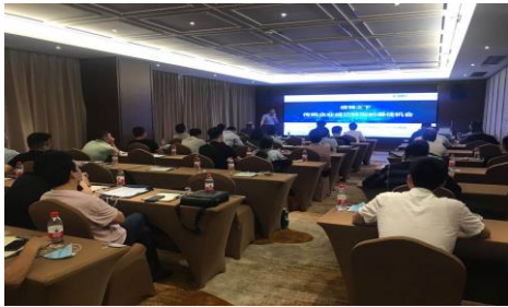
长沙商用产品招商会 5 月 14 日成功举办