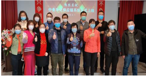
供应链系统 4 月 1 日正式上线运行