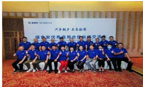
优秀商用合作伙伴交流会 6 月 14 日成功举办