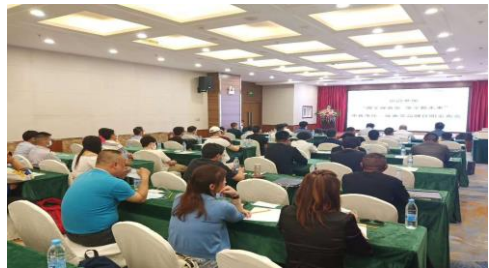
昆明商用产品招商会 5 月 19 日成功举办