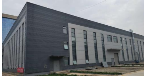
核心工厂 4 月 16 日正式投产