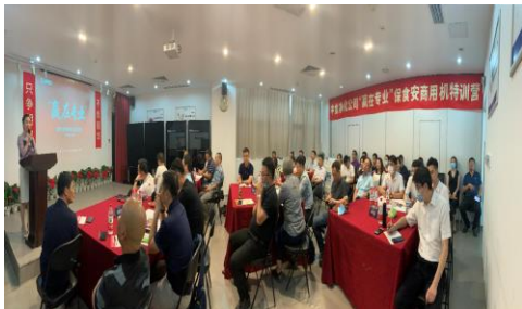
合作伙伴培训会 6 月 10 日成功举办