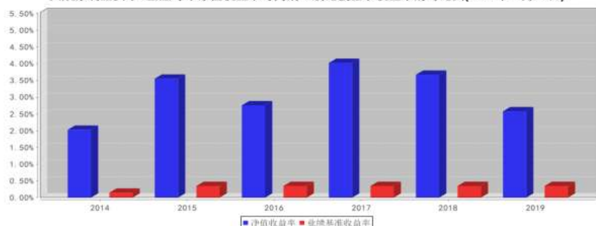
大成添利宝货币E基金每年净值收益率与同期业绩比较基准收益率的对比图(2019年12月31日)