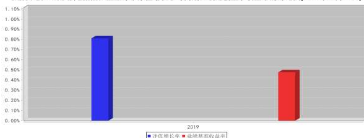
大成中债1-3年国开债指数C基金每年净值增长率与同期业绩比较基准收益率的对比图(2019年12月31日)

注:1、基金的过往业绩不代表未来表现。 2、如合同生效当年不满完整自然年度的,按实际期限计算净值增长率。