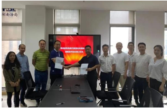
2020 年 6 月 20 日, 母公司与贵州省生产力促进中心签订战略合作协议