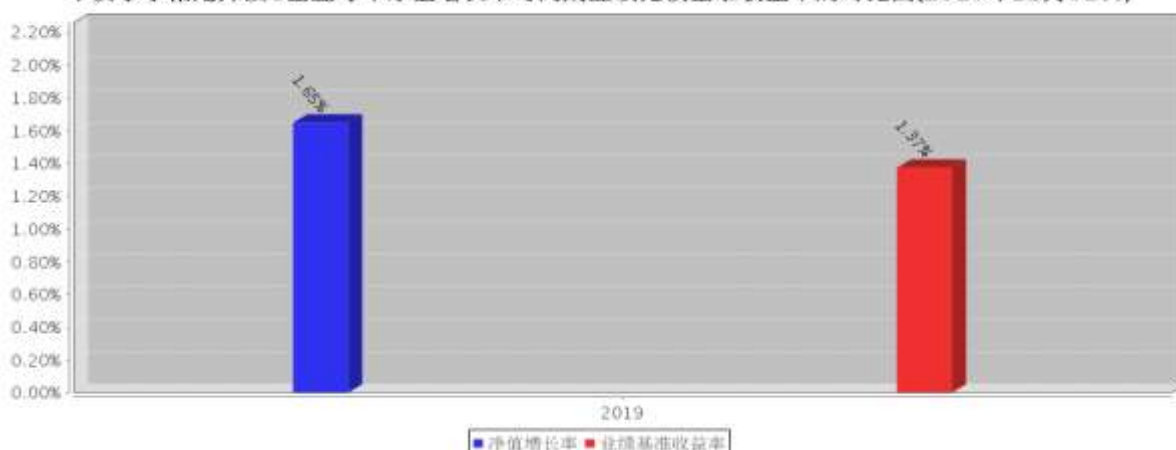
平安季享裕定开债C基金每年净值增长率与同期业绩比较基准收益率的对比图(2019年12月31日)