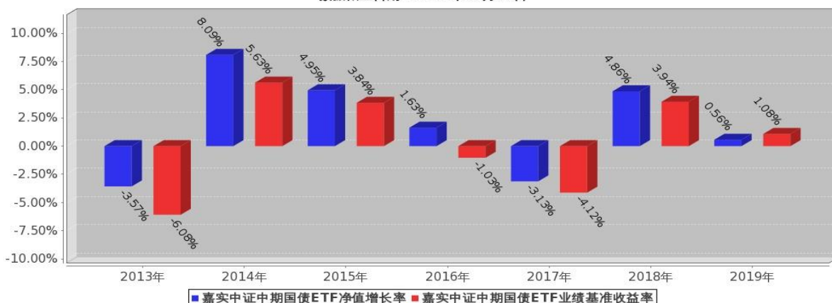
嘉实中证中期国债ETF基金每年净值增长率与同期业绩比较基准收益率的对比图 数据截止日期：2019年12月31日

注:基金的过往业绩不代表未来表现;基金合同生效当年的相关数据根据当年实际存续期计算。