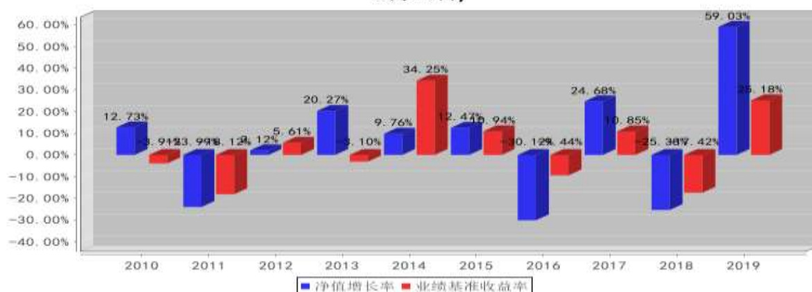
泰达宏利行业混合基金每年净值增长率与同期业绩比较基准收益率的对比图(2019年12月31日)